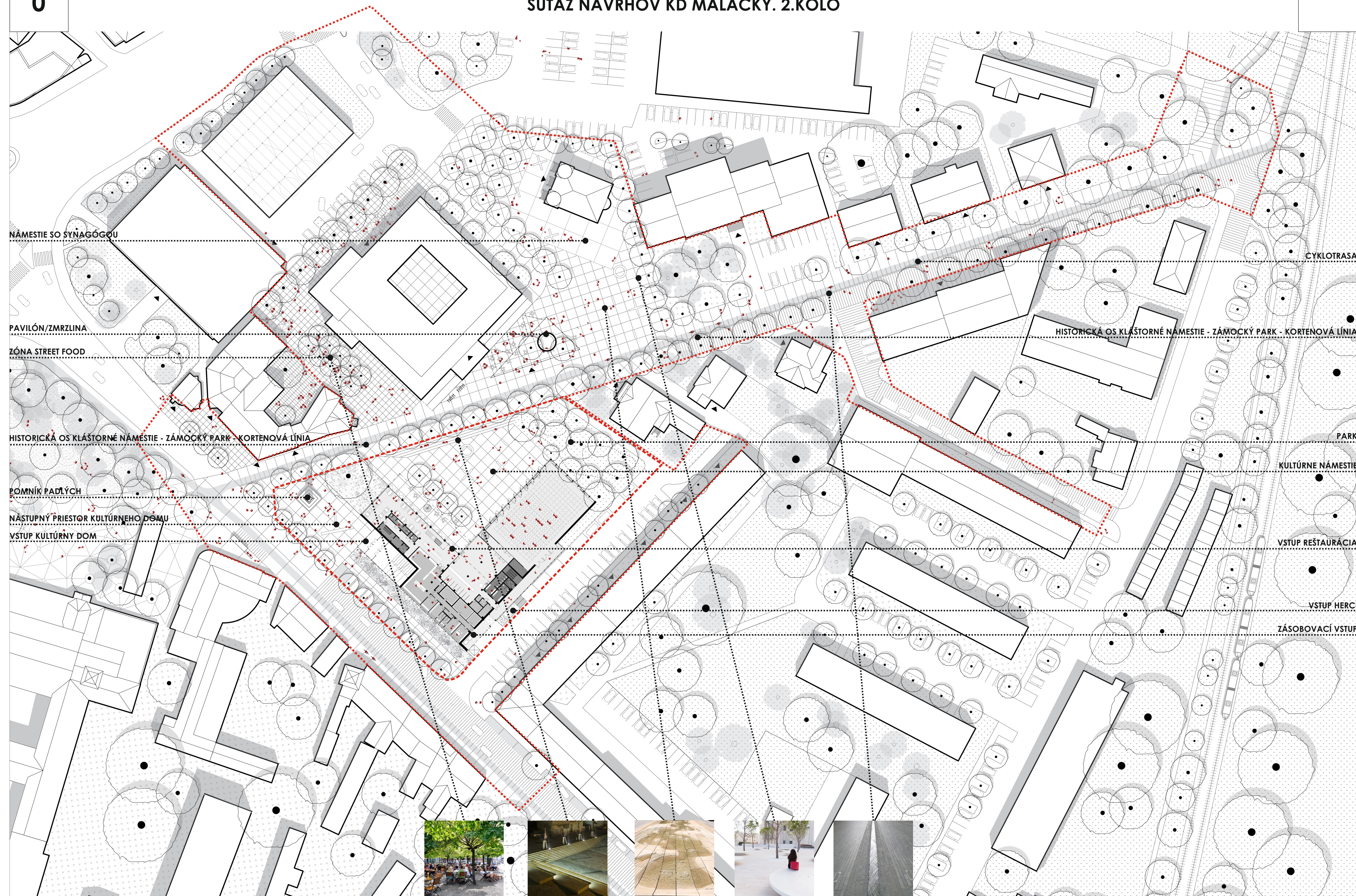
SITUÁCIA S PÓDORYSOM PARTERU M1:600